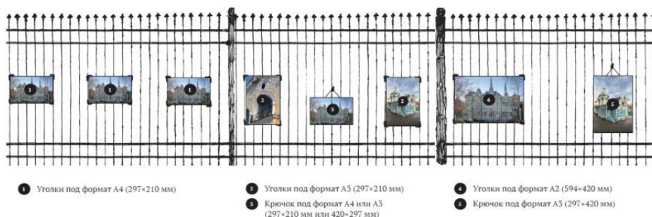
Примерная схема нескольких секций забора

В Томске остается значительное количество закрытых от посторонних глаз кварталов, брошенных объектов, несанкционированных свалок и пустырей. Все эти территории с помощью простой и доступной каждому технологии народного фандрайзинга или краудфандинга могут быть обжиты, освоены, интегрированы в культурную городскую среду, преобразованы в места отдыха и прогулок горожан и гостей города.